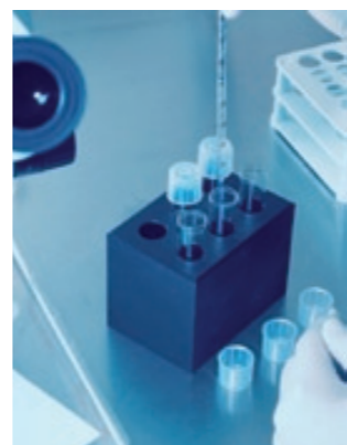
Metoda artificiale e mbarsjes është e lodhshme dhe është e lidhur me ngarkime psikike.

mërisë tek mashkulli. Pasi me rritjen e moshës kualiteti i farës në përgjithësi