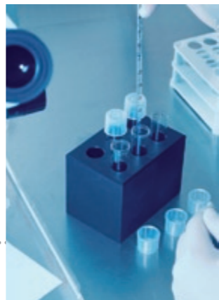
Provrörsbefruktning innebär ofta även en psykisk påfrestning

Problemen är att å ena sidan sjunker spermiekvaliteten med mannens stigande ålder, å andra sidan ökar chansen till en lyckad provrörsbefruktning ju yngre kvinnan är.