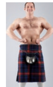
Har spermier drabbats av kristider?

I en stor studie som utfördes i Skottland undersöktes 16,000 spermieprover. Resultatet var nedslående: Enligt studien hade det genomsnittliga antalet normala spermier minskad med nästan 30 % sedan 1989.