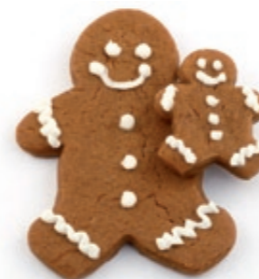
Dietkost kan också inverka negativt på fertiliteten.

Miljörelaterade hormonella störningar, smutsiga miljöer, ändrade kostvanor och födoämnen. Även åldern spelar roll (efter 40 år börjar mannens fertilitet att minska). På grund av detta skall man inte avvakta med att ta ett spermogram. Att vänta förbättrar inte situationen och förbättrar inte fertiliteten.