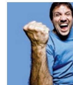
Potens: har ingenting med fertilitet att göra

Bristande spermiekvalité har ingenting med impotens att göra eller att man är en dålig älskare. För att prata klartext. En man som får utlösning är inte automatiskt fertil. Å andra sidan kan även en impotent man bli pappa till ett eller flera barn.